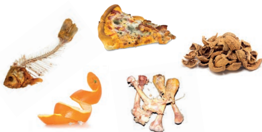
Restes de repas