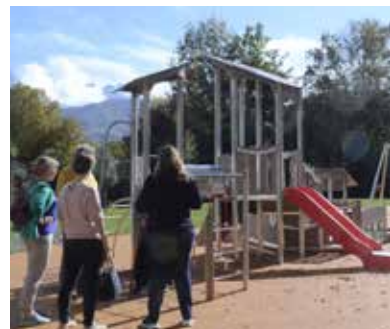
Aménagement de l'Ecrin Vert et installation d'une aire de jeux inclusive finalisés avec l'Union de quartier Buclos/Grand-Pré.