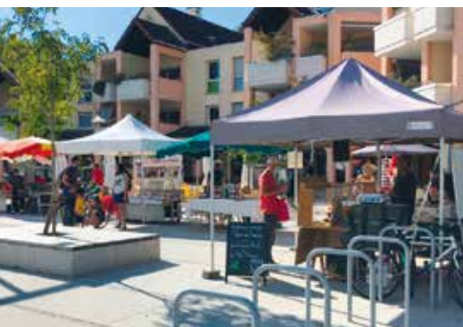
Marché bio et local des Béalières : tous les jeudis de 15h à 19h sur la place des Tuileaux.

les économies réalisées grâce au Plan de sobriété