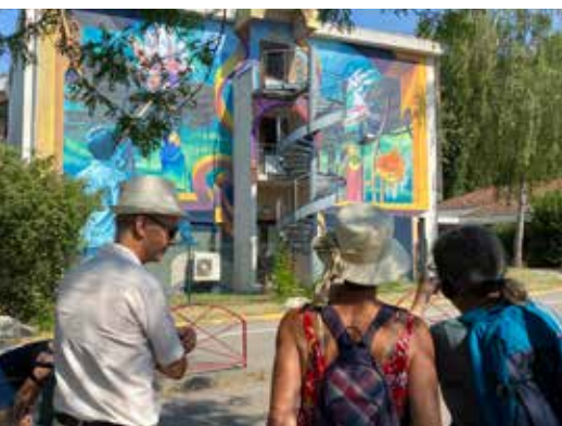
Participation au Street Art Fest Grenoble Alpes, depuis 2022.

Subvention de la Ville au Centre Communal d'Action Sociale (CCAS) en 2023