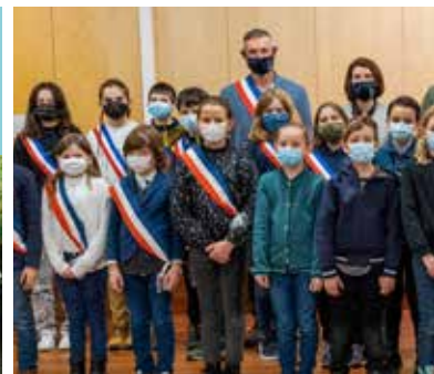
30 élus des collèges et écoles élémentaires de Meylan forment le Conseil municipal des enfants et des jeunes.