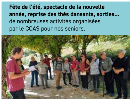
Fête de l'été, spectacle de la nouvelle année, reprise des thés dansants, sorties... de nombreuses activités organisées par le CCAS pour nos seniors.